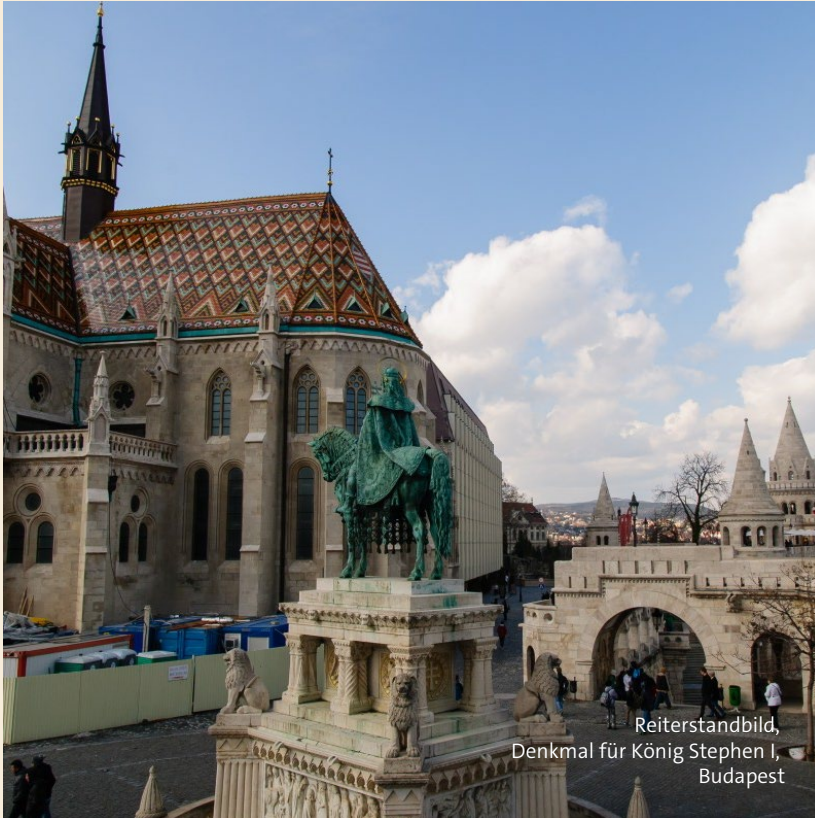
Reiterstandbild, Denkmal für König Stephen I, Budapest