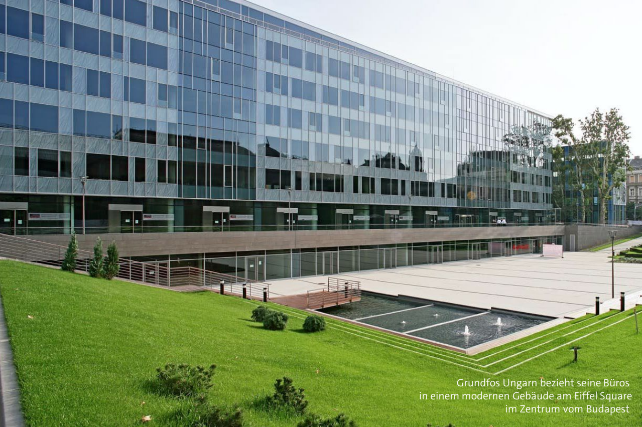
Grundfos Ungarn bezieht seine Büros in einem modernen Gebäude am Eiffel Square im Zentrum von Budapest

“Während meines Aufenthaltes in Ungarn konnte ich nicht nur viel über die Prozesse im Unternehmen lernen, sondern auch viele neue und offene Kolleginnen und Kollegen treffen und deren Kultur kennenlernen.“