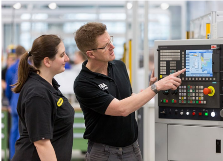
ABB ist ein zukunftsweisender Technologiekonzern mit einem führenden Angebot für digitale Industrien. Aufbauend auf einer über 130-jährigen Tradition der Innovation präsentiert sich ABB heute als Technologieführer in digitalen Industrien mit vier kundenorientierten, weltweit führenden Geschäftsbereichen Elektrifizierung, Industrieautomation, Antriebstechnik