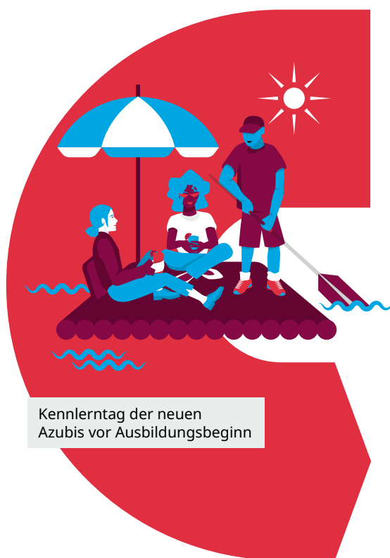
Kennlerntag der neuen Azubis vor Ausbildungsbeginn