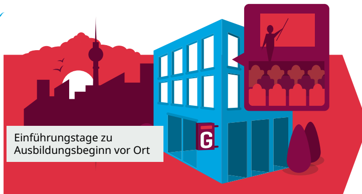
Einführungstage zu Ausbildungsbeginn vor Ort