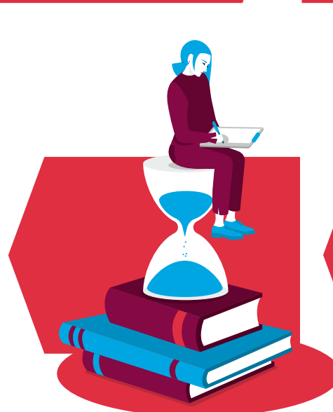
Büffeln für die Berufsschule und interne Seminare