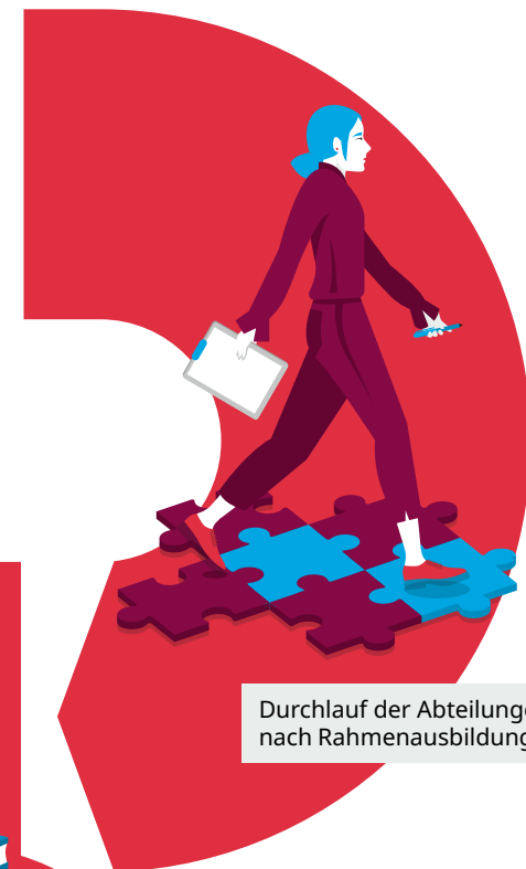
Durchlauf der Abteilungen nach Rahmenausbildungsplan

Neben der klassischen Ausbildung bieten wir auch einen dualen Studiengang an. Informationen dazu finden Sie auf der übernächsten Seite. ▾