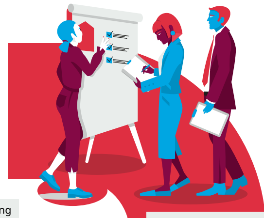
Assessment-Center mit Einstellungstest