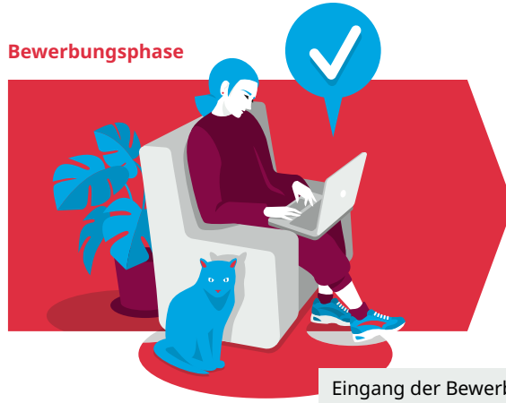
Eingang der Bewerbung