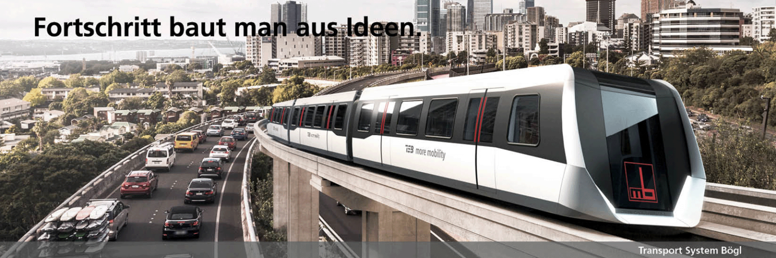
Transport System Bögl