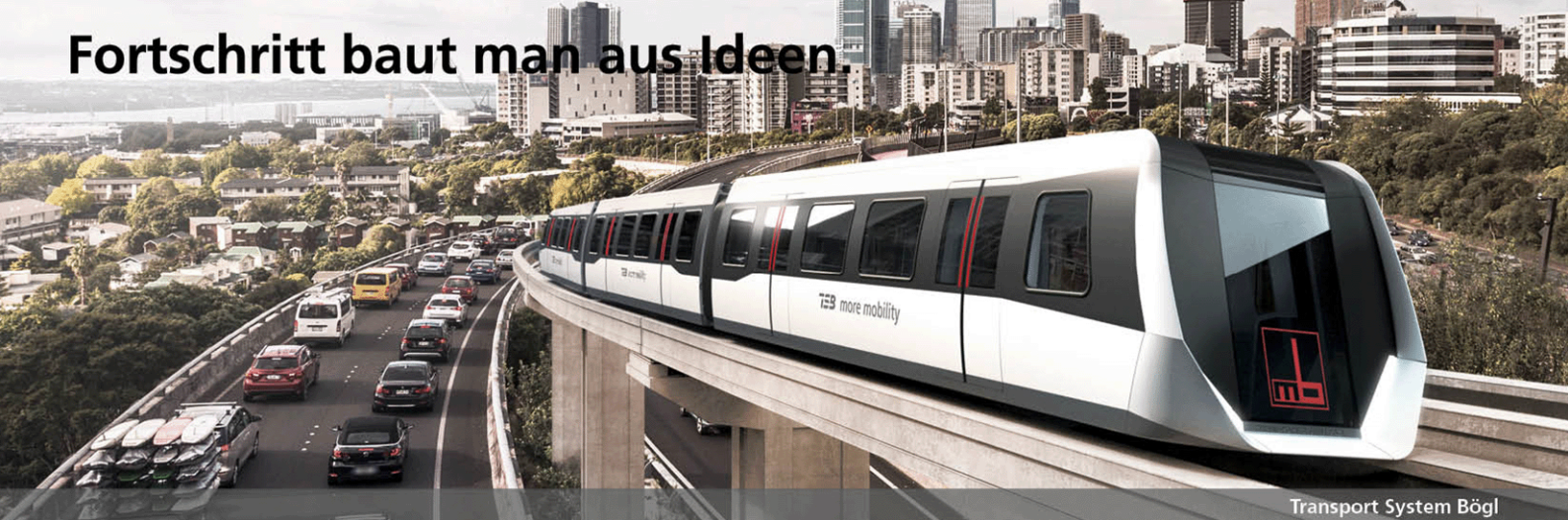
Transport System Bögl

Wir - die Firmengruppe Max Bögl - sind rund 6.500 überzeugte BöglernInnen, erwirtschaften gemeinsam einen Jahresumsatz von über 2,5 Mrd. Euro und sind stolz darauf, dass wir zu den größten Bau-, Technologie- und Dienstleistungsunternehmen der deutschen Bauindustrie gehören.