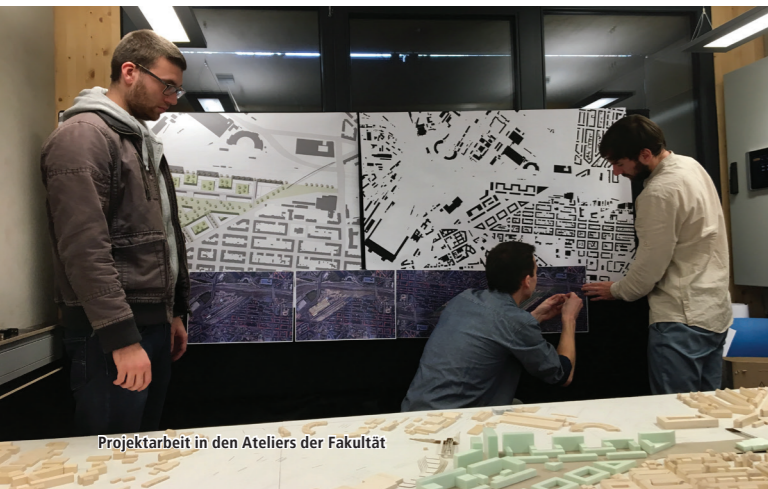
Projektarbeit in den Ateliers der Fakultät