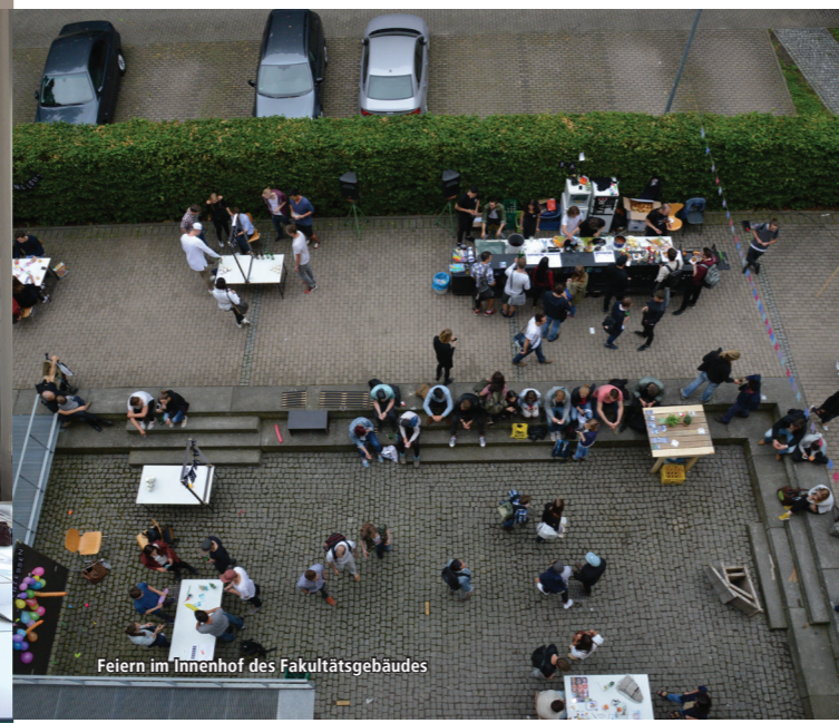
Feiern im Innenhof des Fakultätsgebäudes