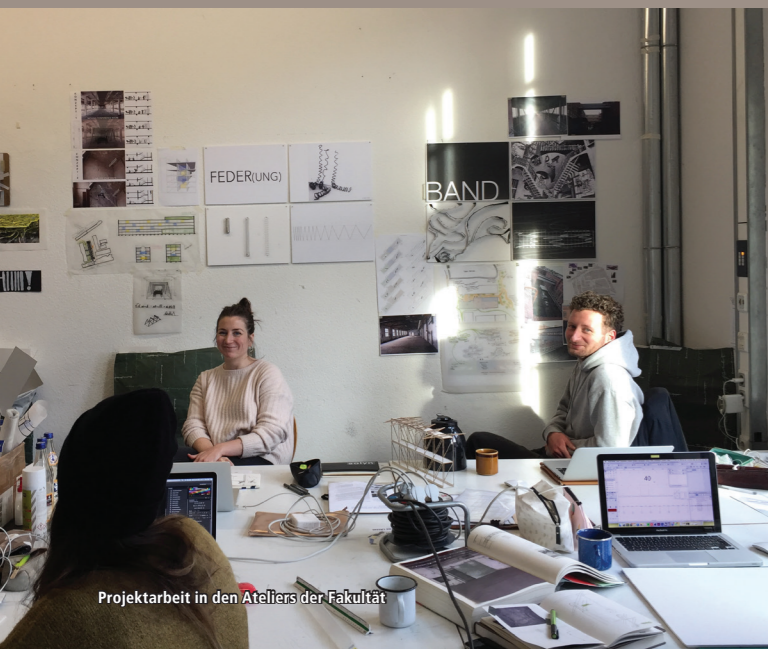
Projektarbeit in den Ateliers der Fakultät