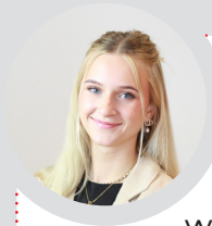
Daria (Studentin Betriebswirtschaft International Business Management)

Durch das frühe Übernehmen von Aufgaben und Verantwortung sowie das Vertrauen, welches mir entgegengebracht wird, hatte ich bereits seit Beginn meiner Ausbildung die Chance, an den Prozessen im Unternehmen teilzuhaben und mich täglich weiterzuentwickeln. Im E-Commerce Bereich kann ich meine Ideen und Vorschläge immer mit einbringen und dadurch den Onlineshop für die KundInnen mitgestalten.