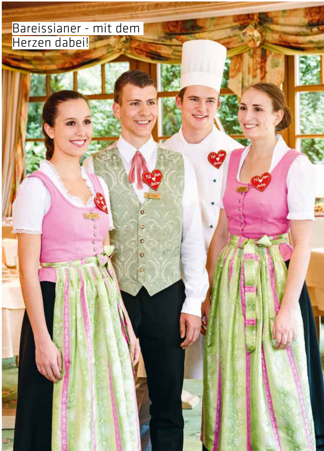
Bareissianer - mit dem Herzen dabei!