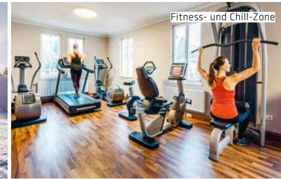
Fitness- und Chill-Zone