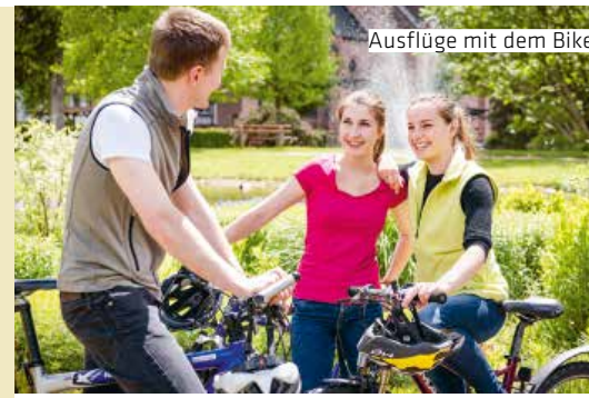
Ausflüge mit dem Bike