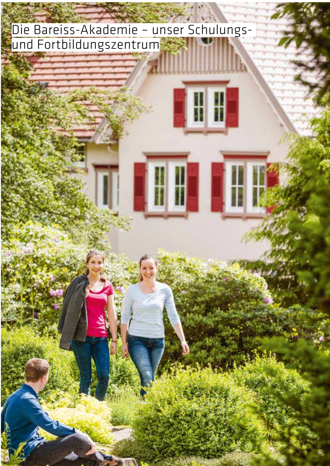
Die Bareiss-Akademie - unser Schulungs- und Fortbildungszentrum